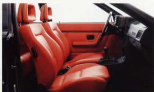
Lederinnenausstattung – Farbe nach Kundenwunsch